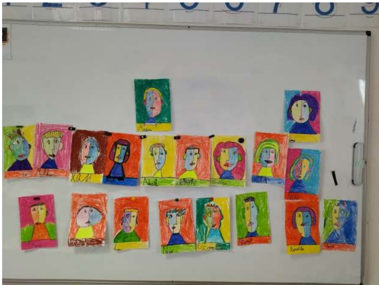
Classe des CP bilingues